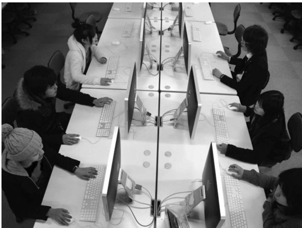
デジタル表現技術教育専用設置された Macintosh

本プログラムは、高度情報化社会のニーズに対応した教育プログラムです。パソコンのスペックは様々ですが、高度なクリエイトスキルを磨くには、その目的にあったスペックのパソコンとソフトウェアが必要です。Apple 社の Macintosh を使って、Web や映像、CG、音響作品をつくっていきます。作品をつくることで本物のスキルが身につきます。